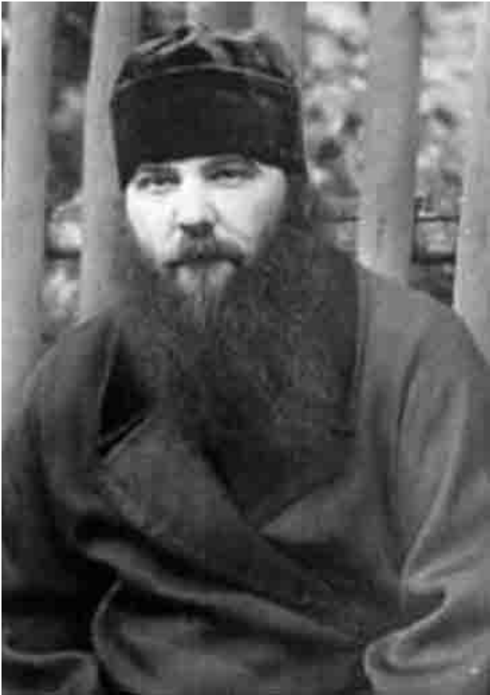
Епископ Великоустюжский и Устьвымский ПИТИРИМ (Крылов)