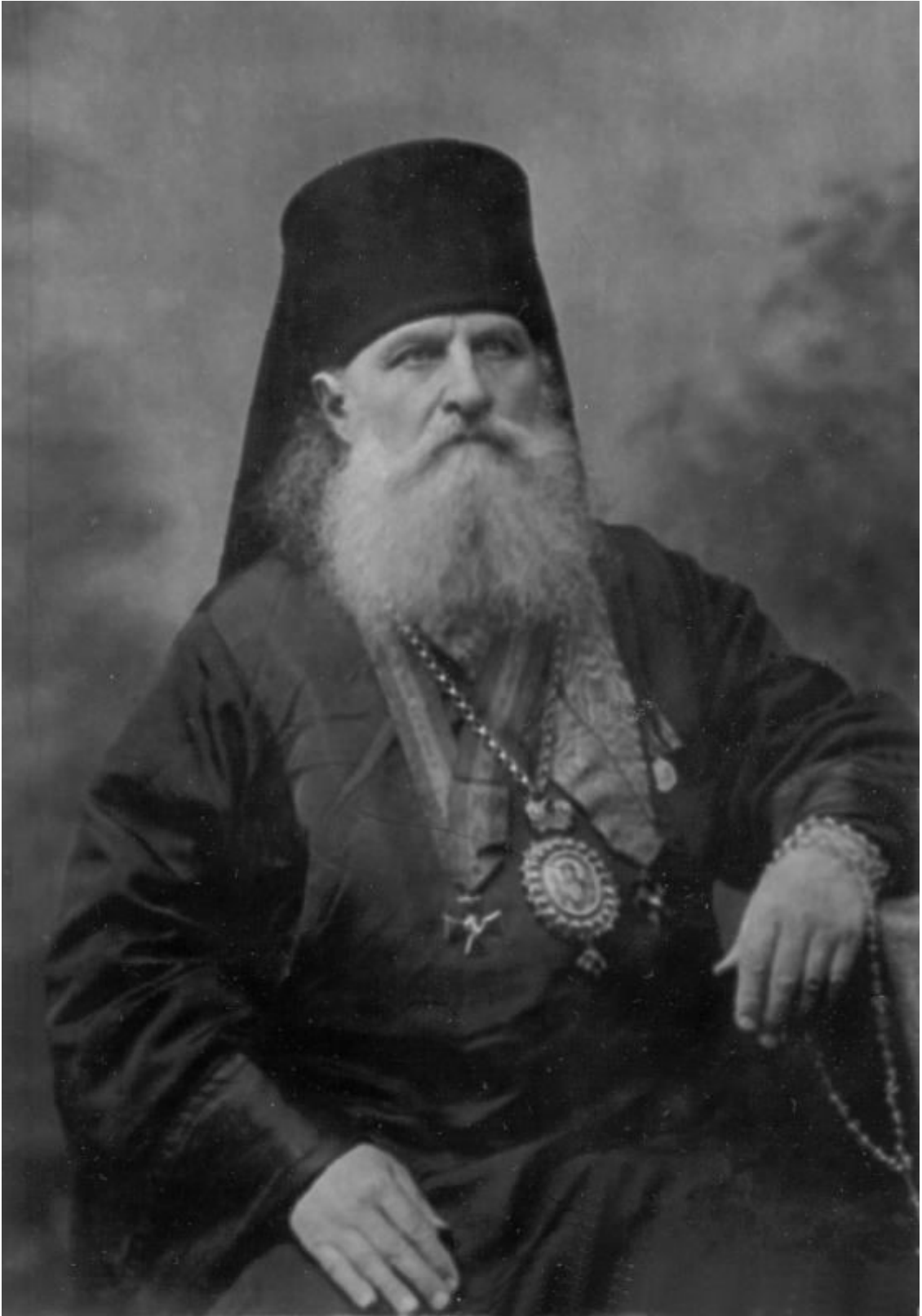
Епископ Великоустюжский и Устьвы́мский АЛЕКСИЙ (Бельковский)