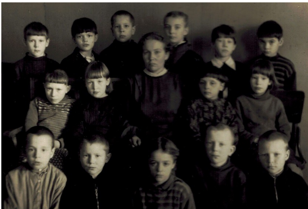
1 класс Зеленецкой школы.