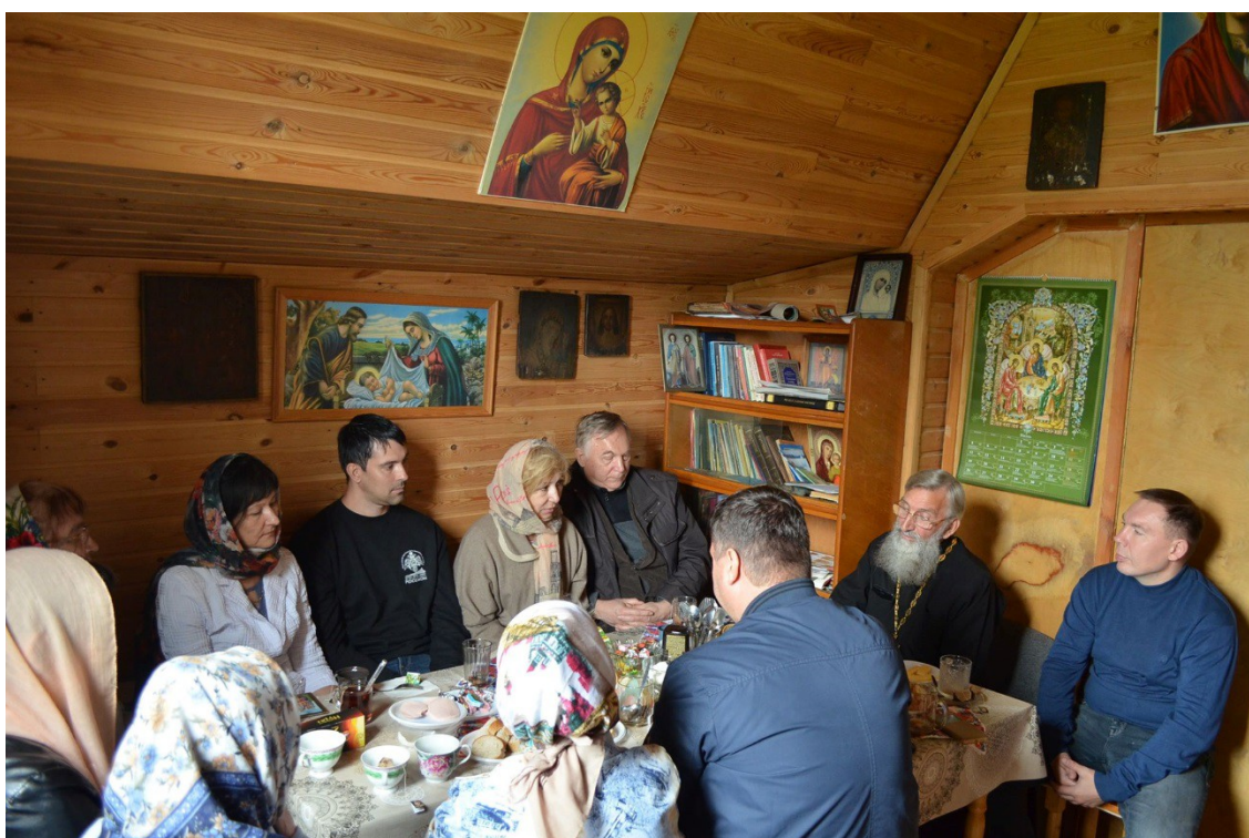
В 2019 г. Додзь. Встреча с батюшкой.