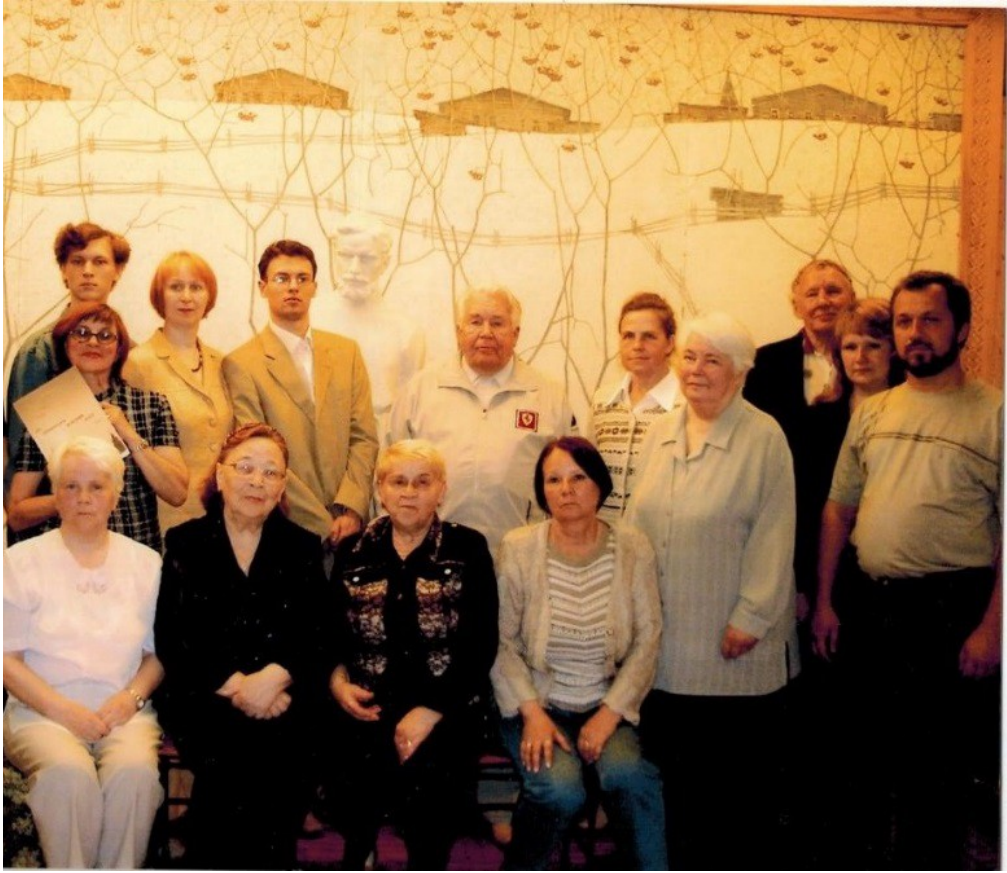
Встречи в Куратовском музее.