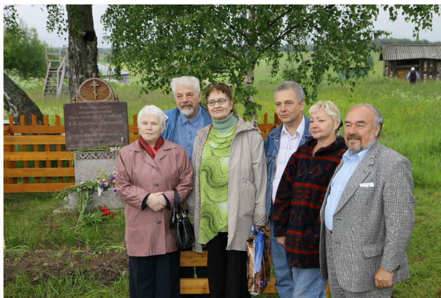
Чухлом. 2009 г. Потомки Куратовского рода

Много было публикаций в газетах «Вера» и «Епархиальные ведомости» о новомучениках, подготовленные на материалах потомков. Были изданы родословные Покровских, Спасских, Вишерских, Бронниковых, Куратовых, Поповых и др.