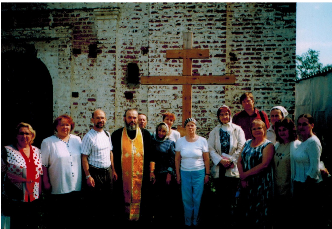
Зеленец 2006 г.