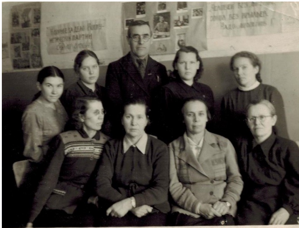
Учителя Зеленецкой НСШ. 1953 год.

литературы и была для меня самым близким и любимым человеком.