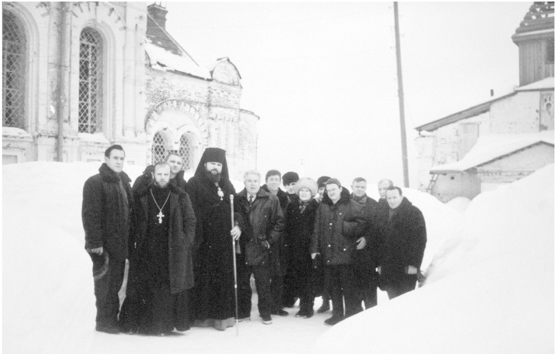
2003 год. Усть-Нем. Поездка с родственниками святого Димитрия Спасского.