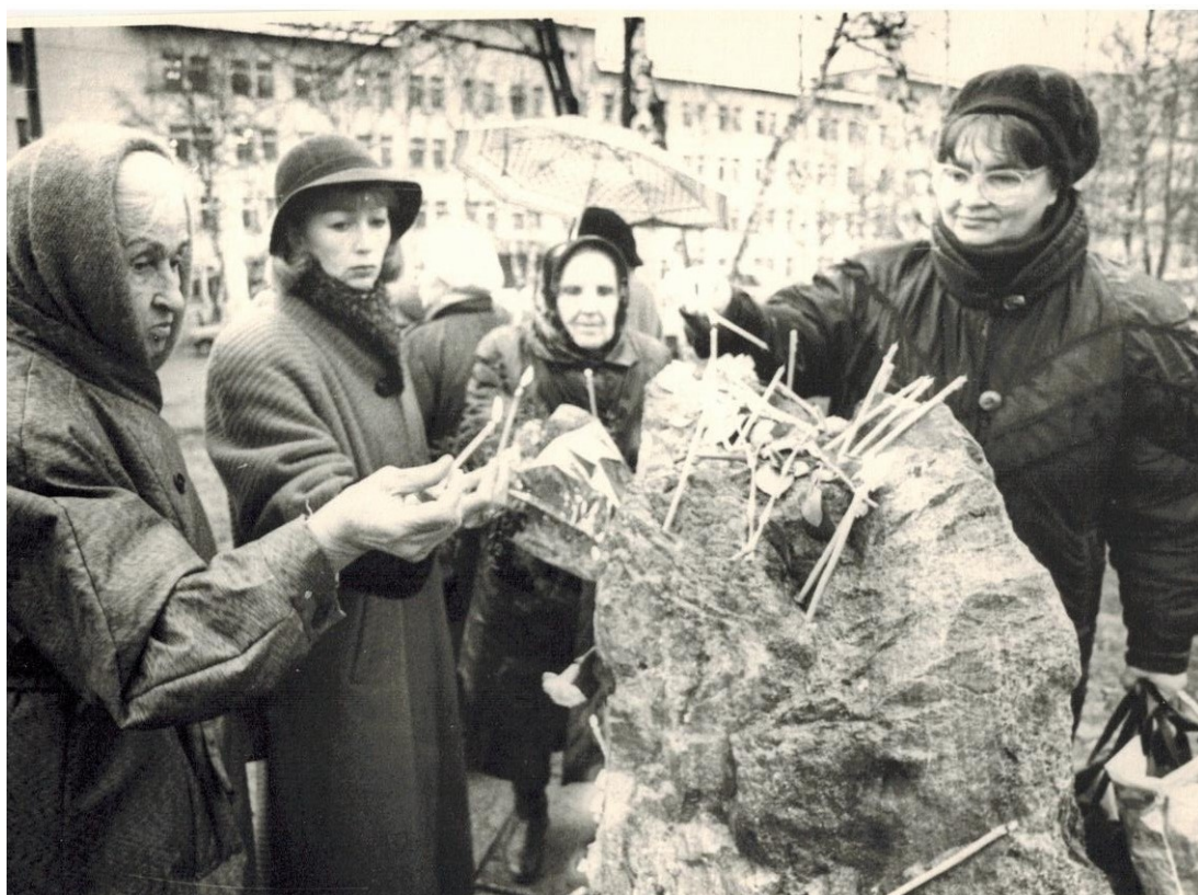
1998 год. Камень на месте будущей часовни.