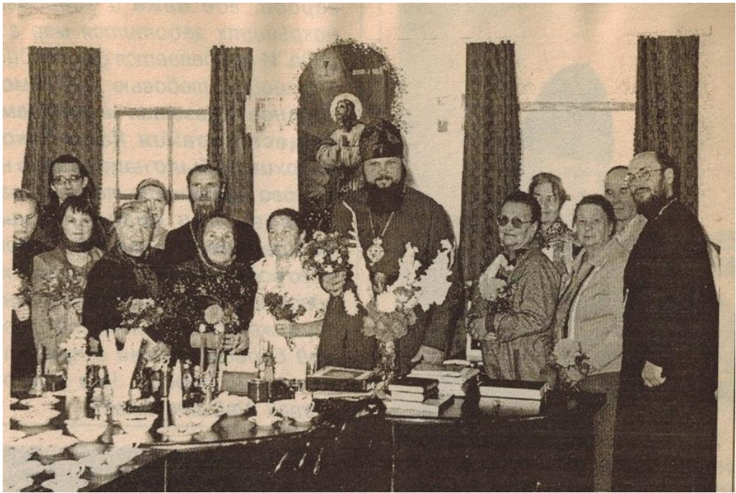
2001 год. У Владыки.