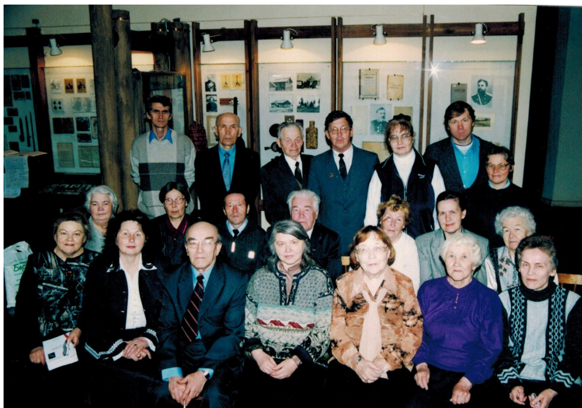
Национальный музей. Краеведы.

К сожалению, многих моих единомышленников уже нет в этом мире, но они остались в моём сердце. Вся моя жизнь на протяжении более 30 лет была наполнена нашими встречами, совместными поездками. Общение с родными, придавало смысл моей жизни. Это в своих родных я находила поддержку и опору в непростые 90-е гг. XX века.