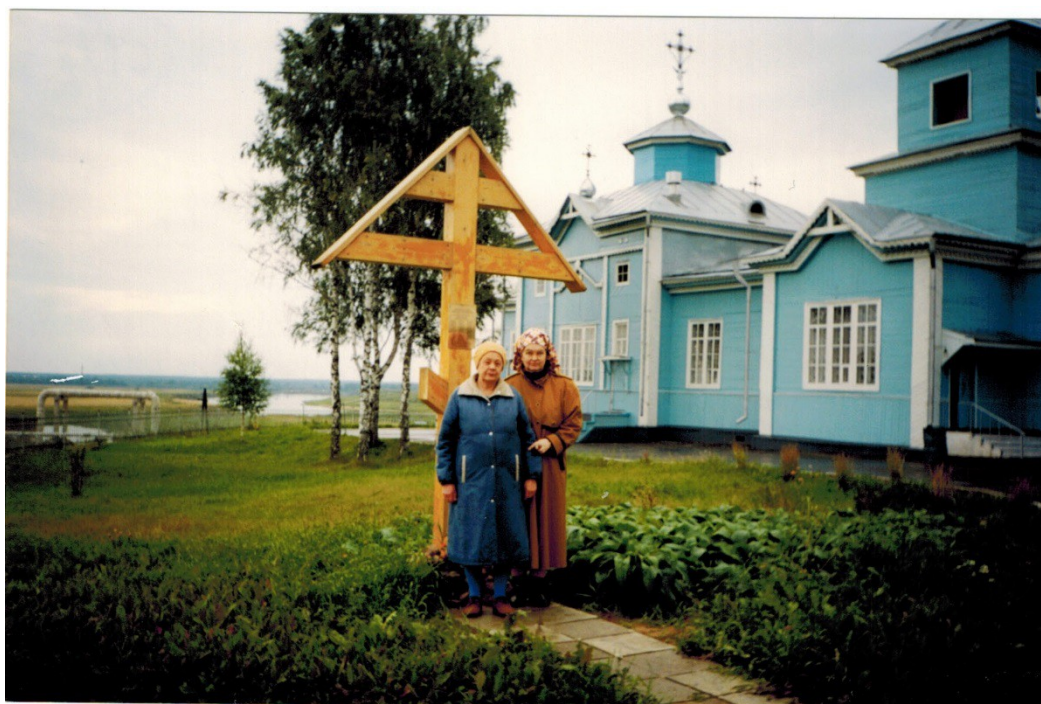
Памятный Крест возле Свято-Казанского храма.