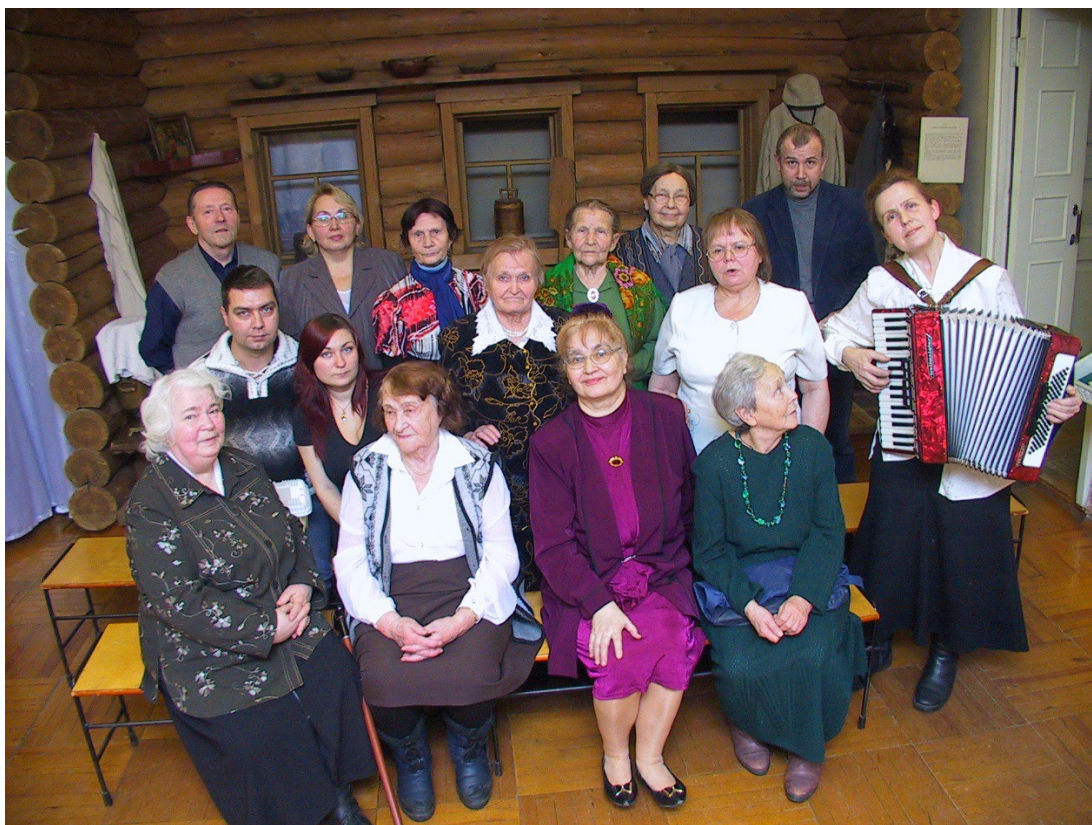
2007 г. Куратовский музей. Родовая община.