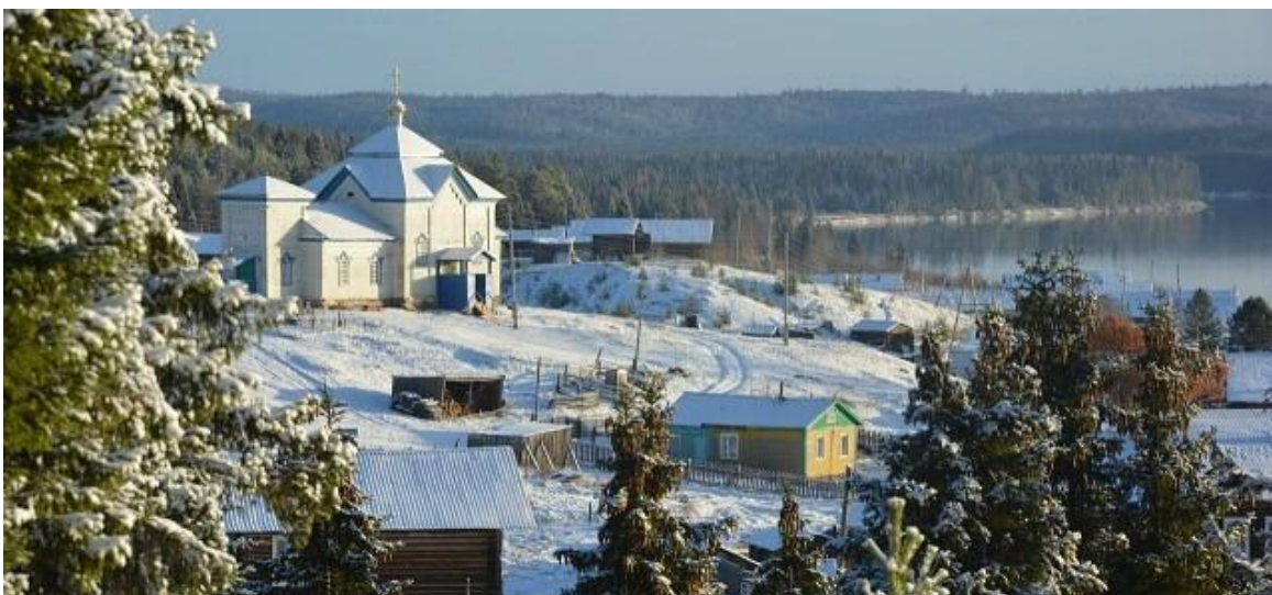
Сёлыб. Богоявленская церковь.