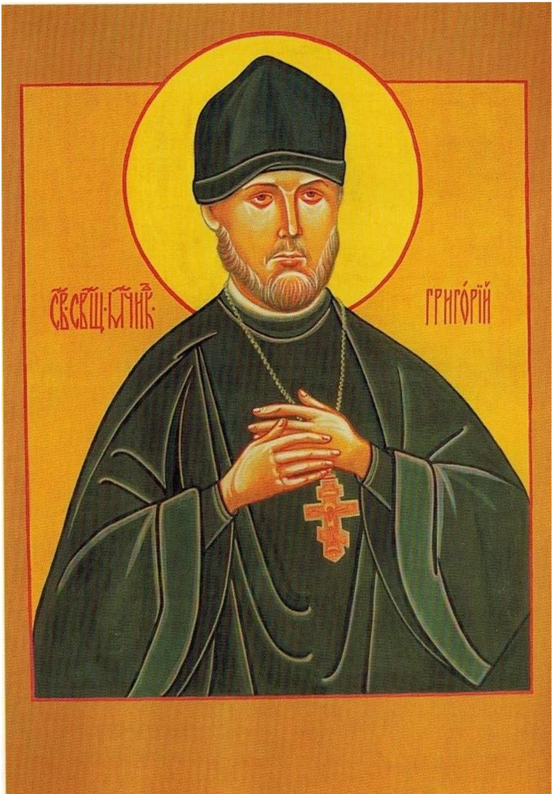
Святой Григорий Бронников