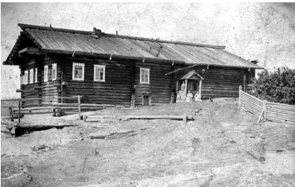
Сёлыб. Дом священника.